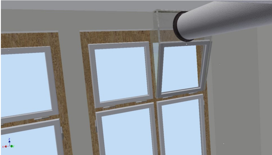
Abbildung 1: CAD-Modell einer Ventilatorbox gebaut aus Polycarbonat Doppelstegplatten und Alu-Eckprofilen für Denkmalschutz- und Wärmeschutz kompatiblen Anschluss des Abluftventilators an ein Kippfenster. Das Fenster bleibt voll funktionsfähig und kann über die vorhandenen OL90 Fernbedienung außerhalb der Unterrichtszeit geschlossen werden, so dass kein zusätzlicher Wärmeverlust entsteht.