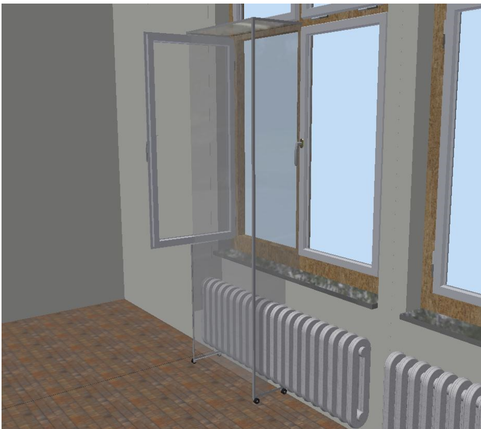
Abbildung 2: CAD Modell eines beweglichen (rollbaren) Vorbaus, gebaut aus Polycarbonat Doppelstegplatten, Alu-Eckprofilen und Möbelrollen zur Denkmalschutz-, Wärmeschutz- und Behaglichkeits-kompatiblen Einleitung der Frischluft von einem Fenster auf den Boden (vollständig oder partiell geöffnete Drehfenster oder Kippfenster). Das Fenster bleibt voll funktionsfähig und kann außerhalb der Unterrichtszeit geschlossen werden, so dass kein zusätzlicher Wärmeverlust entsteht.